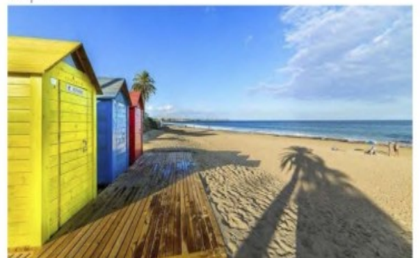
En Vila Martín, una de las zonas más bonitas de Orlhuela Costa, se encuentra Filipinas Island. Esta villa de lujo se encuentra en un enclave natural que combina a la perfección sol, mar y montaña. Esta disposición se caracteriza por el típico clima propio de la Costa