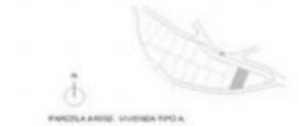
PARCELA 01 - VIVIENDA TPO A

La empresa promotora se reserva el derecho de hacer las modificaciones pertinentes dentro de los límites que puedan producirse en la normativa legal o por requerimiento de los organismos oficiales, sin que ello cambie sustancialmente por la distribución funcional y/o prometedora. Proyecto arquitectónico. Reservados todos los derechos. No se permite la explotación, ni la reproducción total o parcial de este documento, ni su difusión o tenencia sin previa autorización expresa.